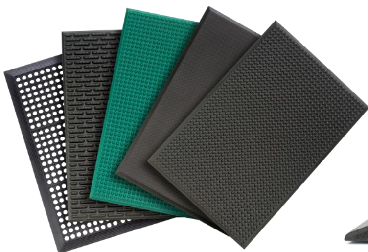
Dostępne modele mat

Mata zaprojektowana i wykonana w specjalnej technologii, zachowuje swoje właściwości , w szczególności właściwości sprężyste przez cały okres użytkowania (gwarancji)