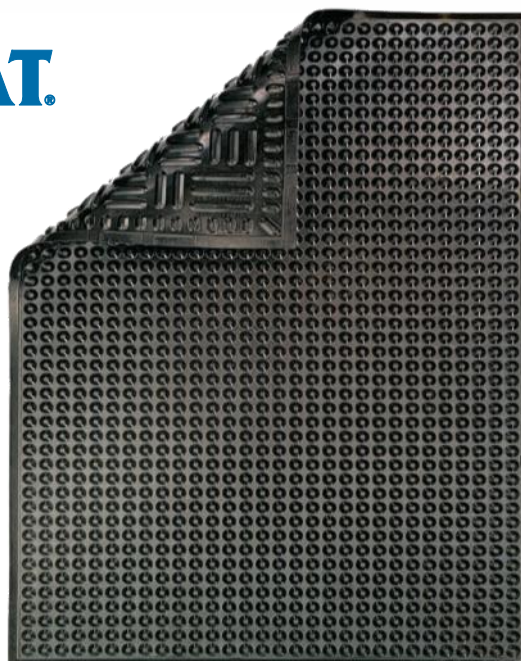
Mata typu NITRIL