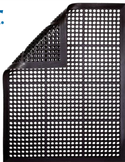
Maty typu ENDURANCE