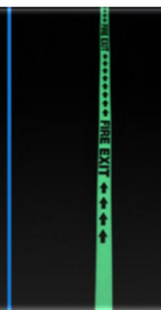
Po 30 MIN