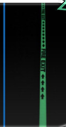
Po 60 MIN

Dostępne są również ZNAKI fluorescencyjne DuraStripe